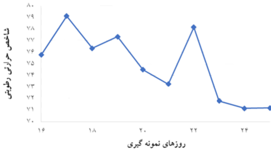
شکل ۱. شاخص حرارتی-رطوبتی در طول روزهای آزمایشی